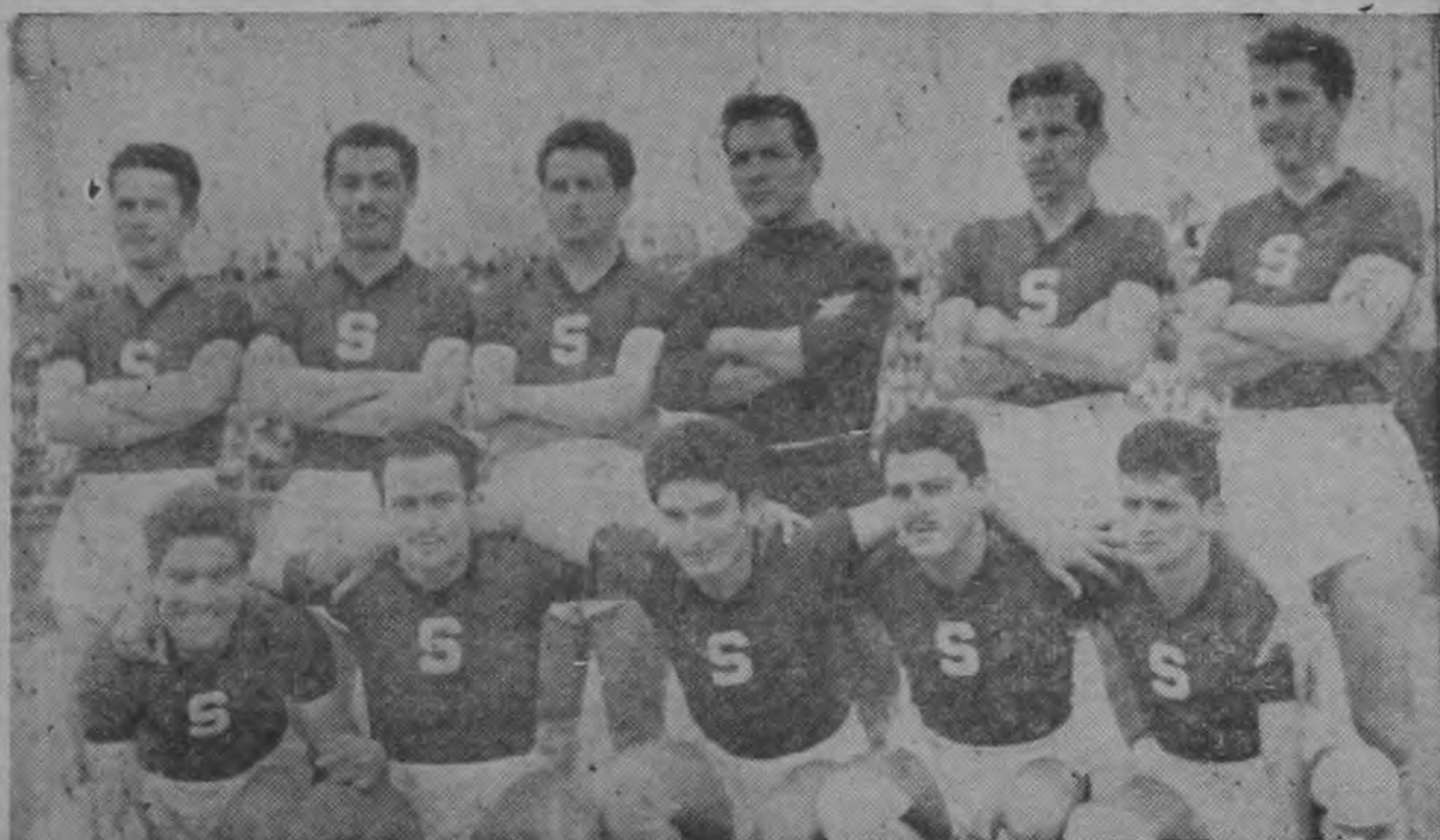
Los campeones nacionales serán los que inauguren la gran serie Cuadrangular de Fútbol Internacional, enfrentándose al poderoso cuadro HURACAN el domingo primero de Enero en la graminilla del estadio capitalino